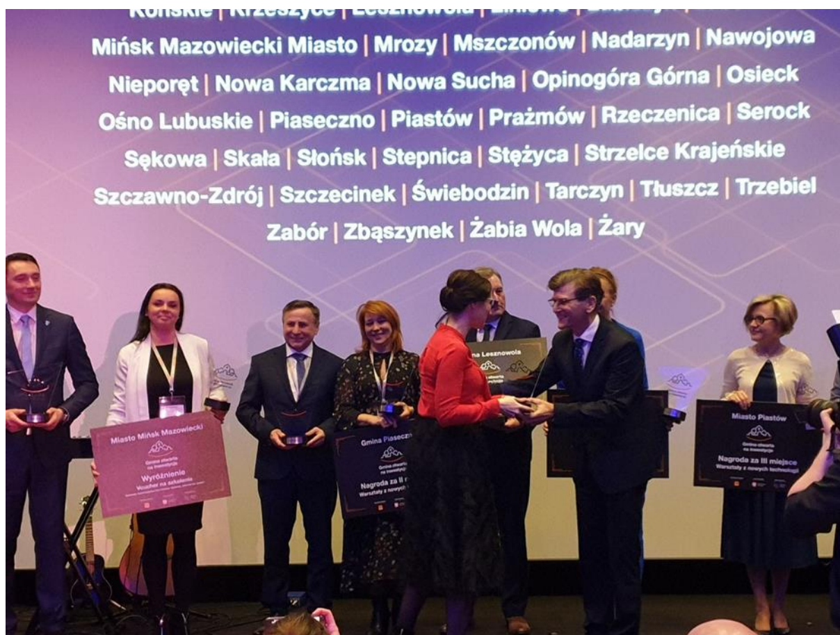
Gala wręczenia statuetek „Gmina Otwarta na inwestycje” Lublin 2020r.