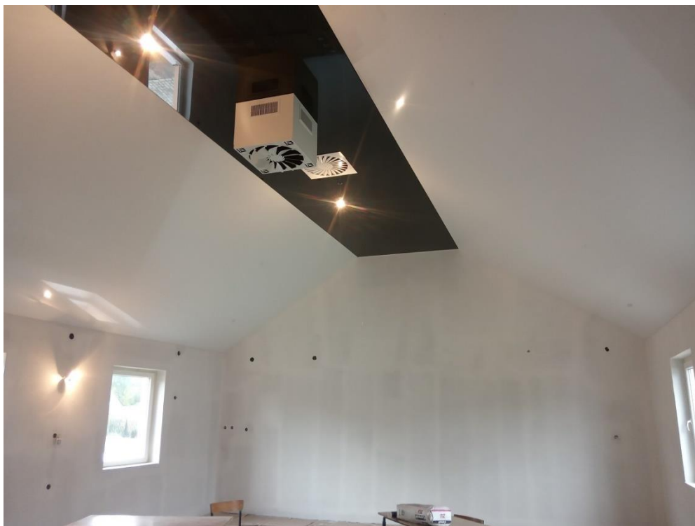
Na zdjęciu Sala w trakcie remontu w budynku OSP w Górkach.

Zakup z dostawą i montażem wyposażenia sali sensorycznej dla Publicznego Żłobka w Sobienkach – Zapytanie ofertowe wygrała firma NowaSzkola.Com. Zakupiono szereg produktów wyposażenia takie jak: wałki do masażu, półkule sensoryczne, lustro logopedyczne i inne. Koszt: 9 852,00zł brutto.