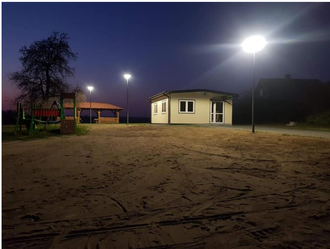
Na zdjęciu nowe lampy przy świetlicy w Nowych Kościeliskach po montażu.