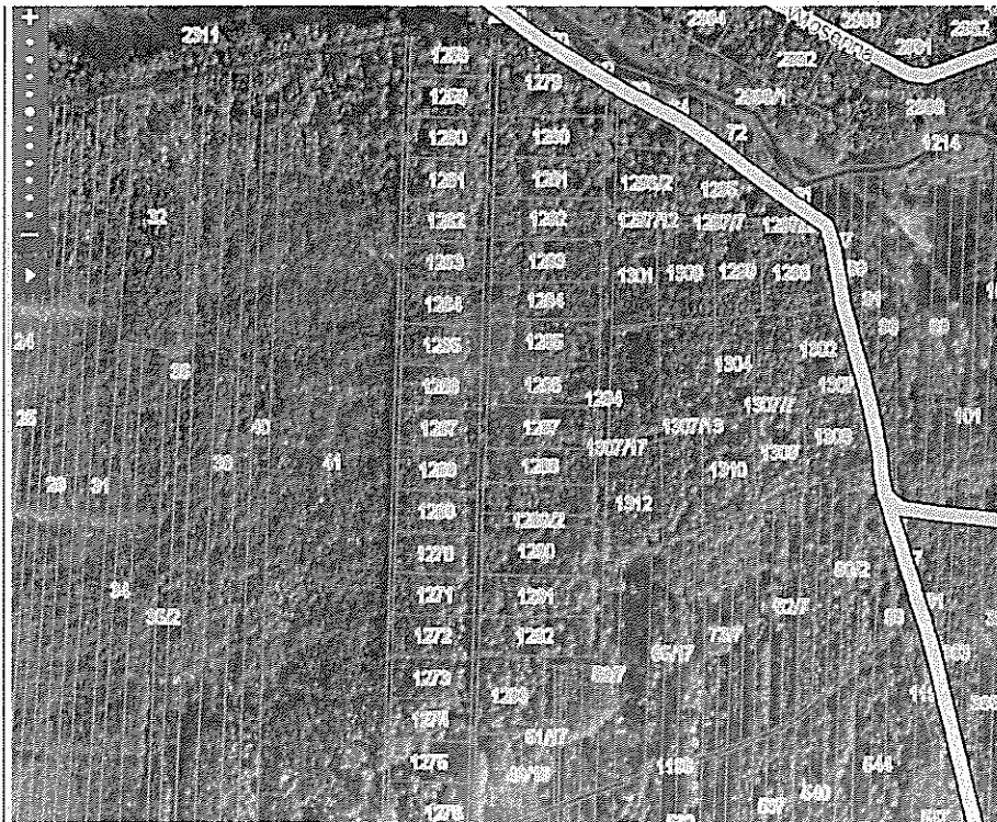
Rys.4 Kompleks działkowy „za Leśniczówką”