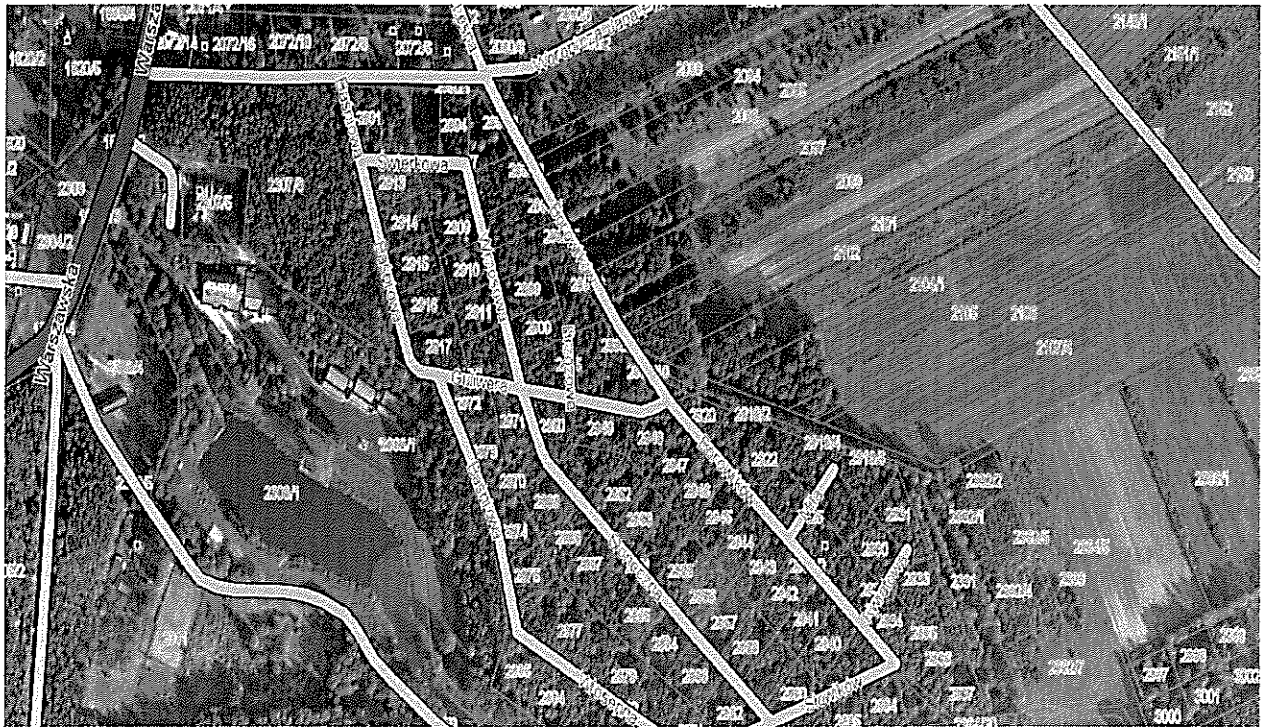
Rys. 3 Kompleks działkowy „Chabaszew”