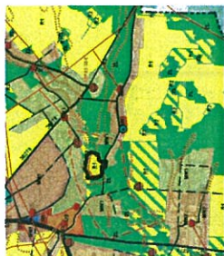
Granice terenu objętego planem