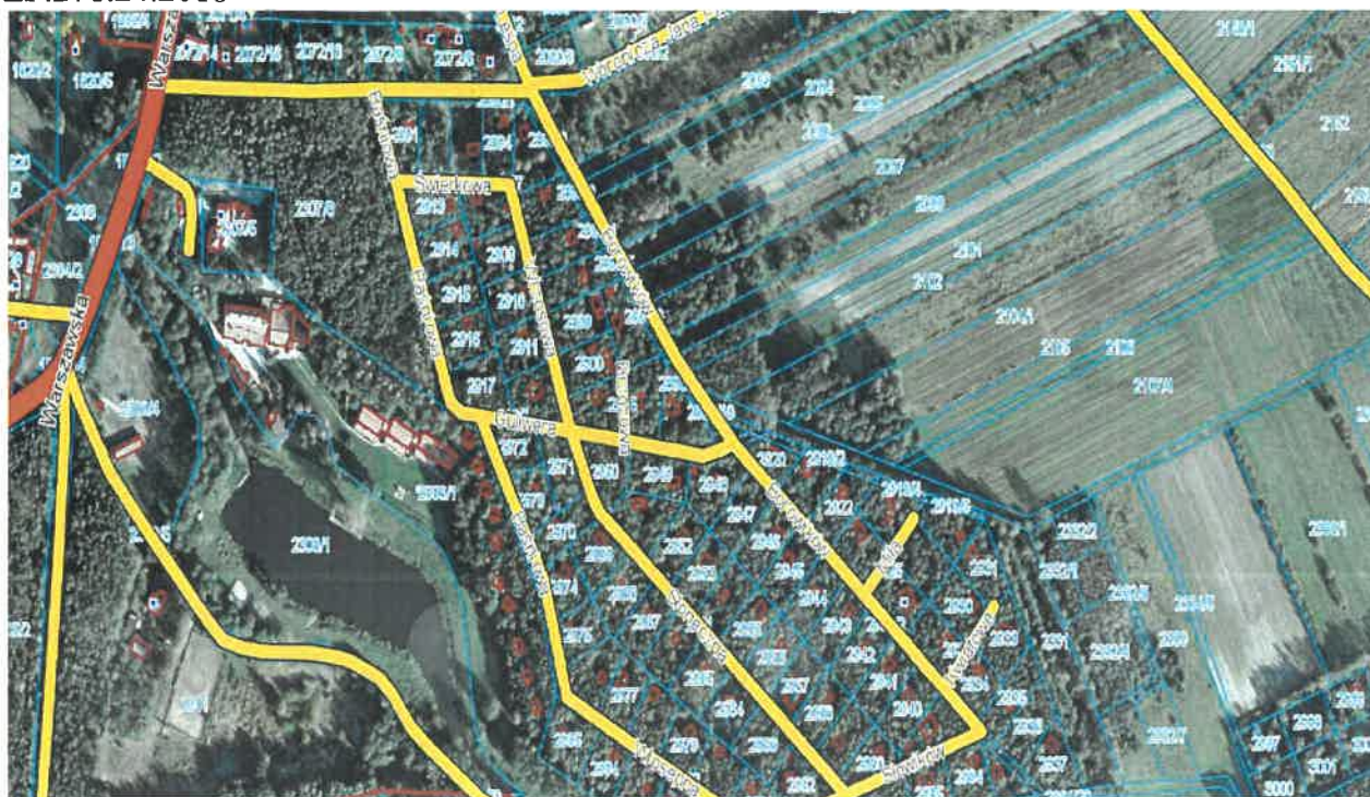
Rys. 3 Kompleks działkowy „Chabaszew”